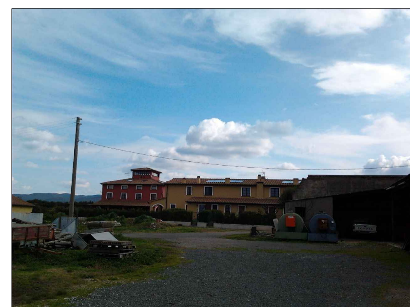
FOTO 1 LINEA ELETTRICA A BASSA TENSIONE