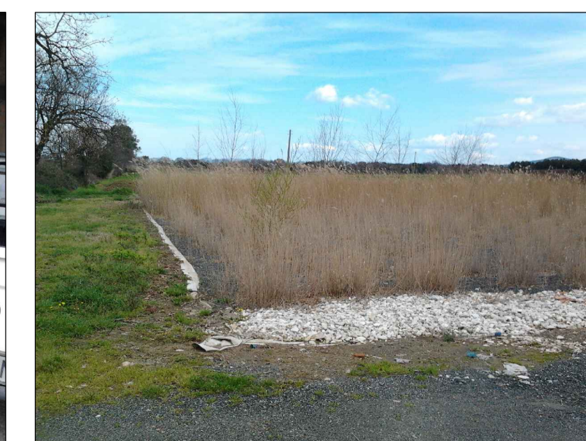
FOTO 4 FITODEPURAZIONE