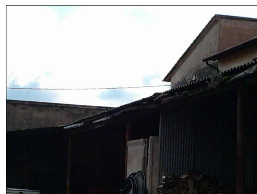
FOTO 2 LINEA ELETTRICA A BASSA TENSIONE