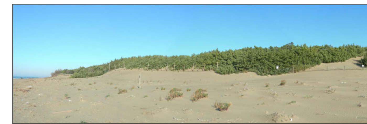
10 - La spiaggia e il tombolo