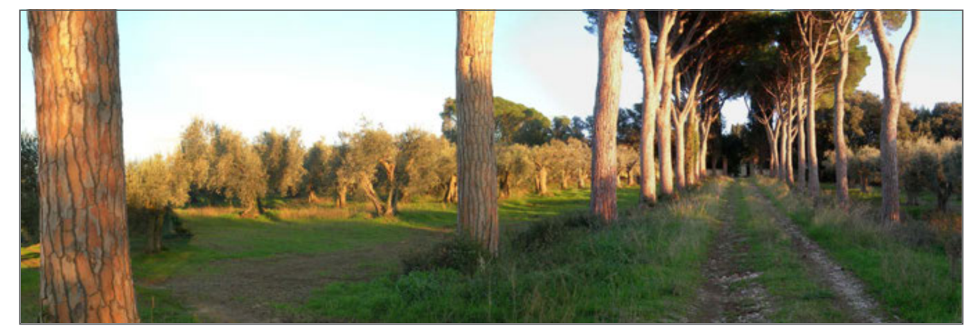
2 - Viale Serristori e l'oliveto a nord dell'area di trasformazione