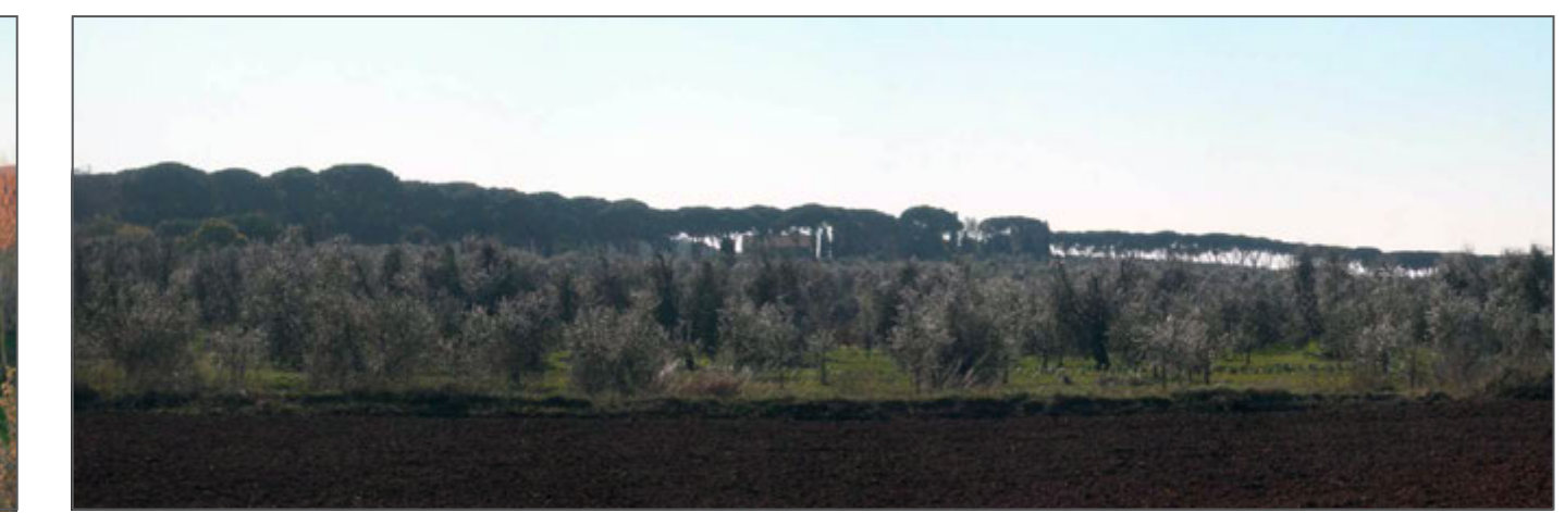
6 - L'oliveto a nord e la Villa Serristori, visti da via Accattapanè