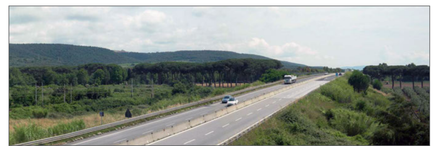
1 - Il Viale Serristori visto dall'autostrada