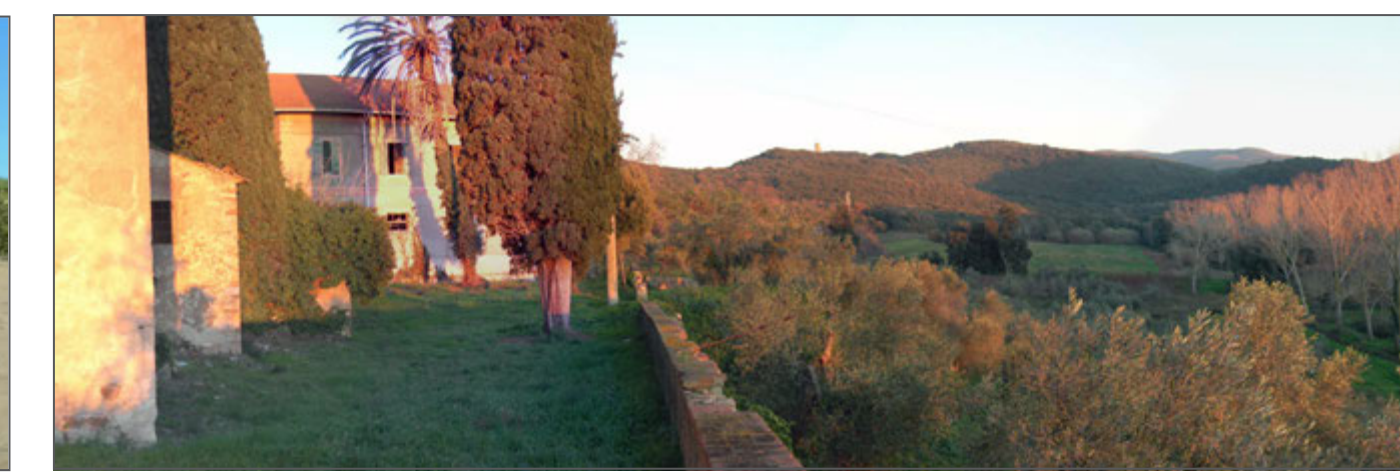
7 - La Torre Donoratico e il Fosso dell'Acqua Calda visti dalla terrazza panoramica della Villa Serristori