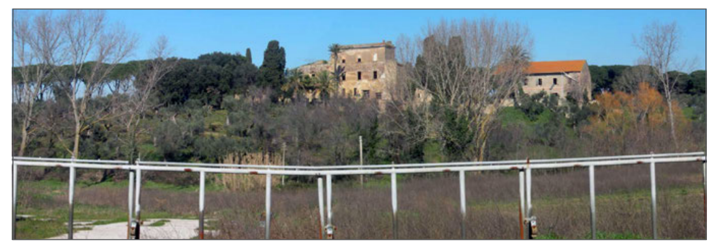
3 - Viale Serristori vista da sud