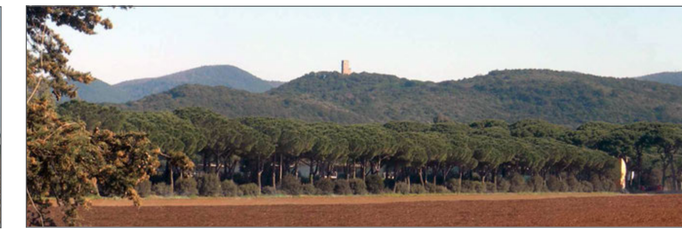
8 - La Torre Donoratico e i viali alberati