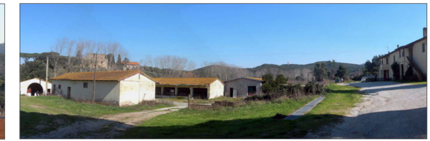
5 - L'ex centro zootecnico, podere le Porcarecce