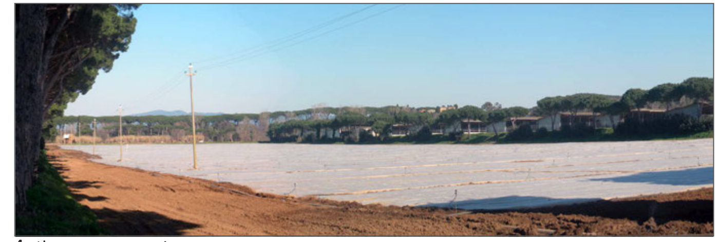
4 - L'ex centro zootecnico