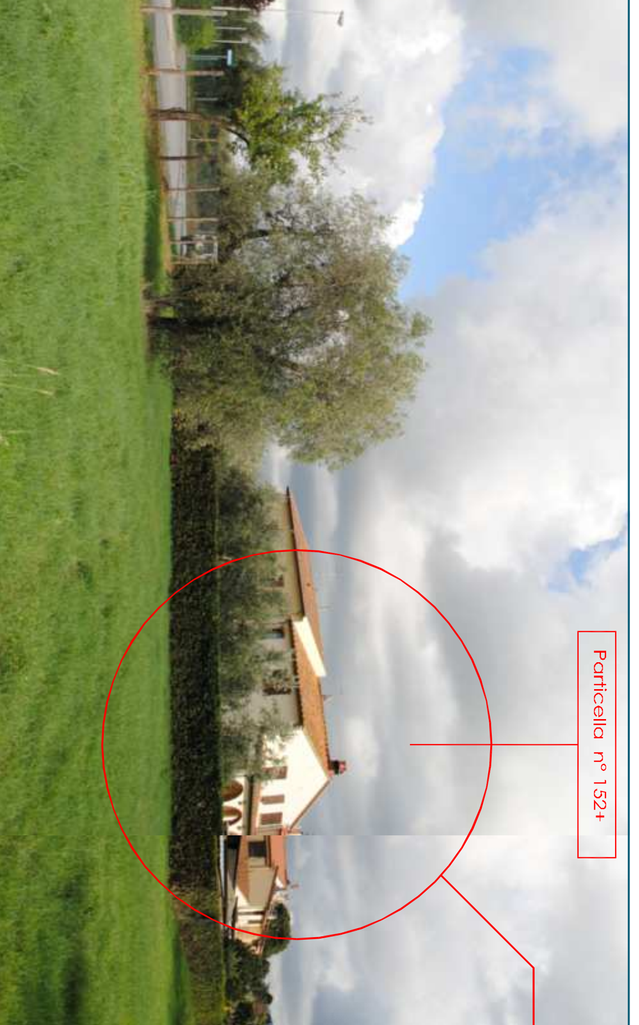
Particella n° 1321