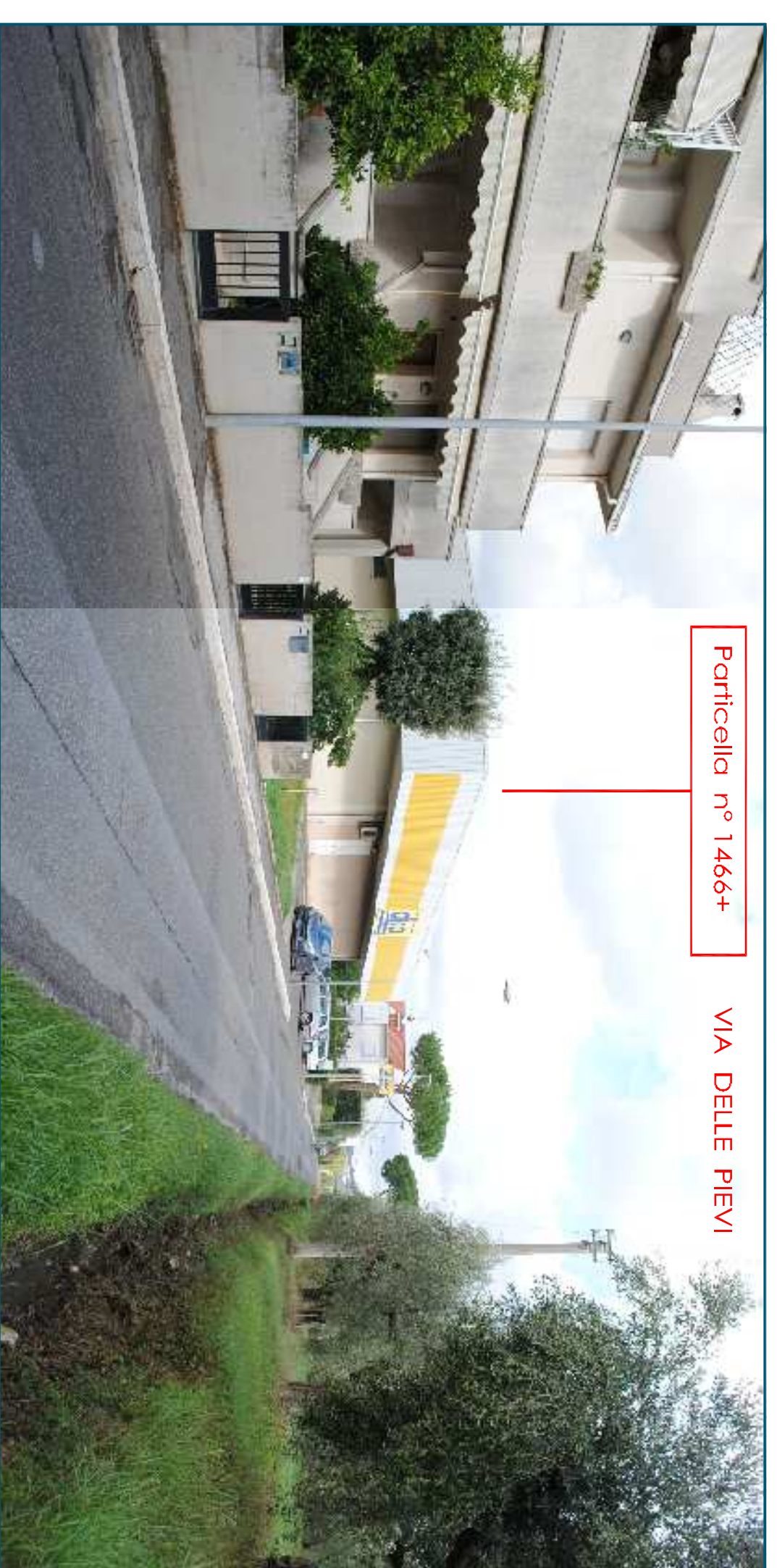
Particella n° 1466+