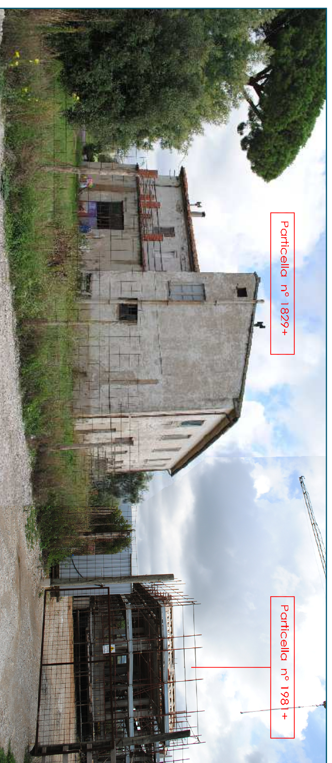
Particella n° 1829+