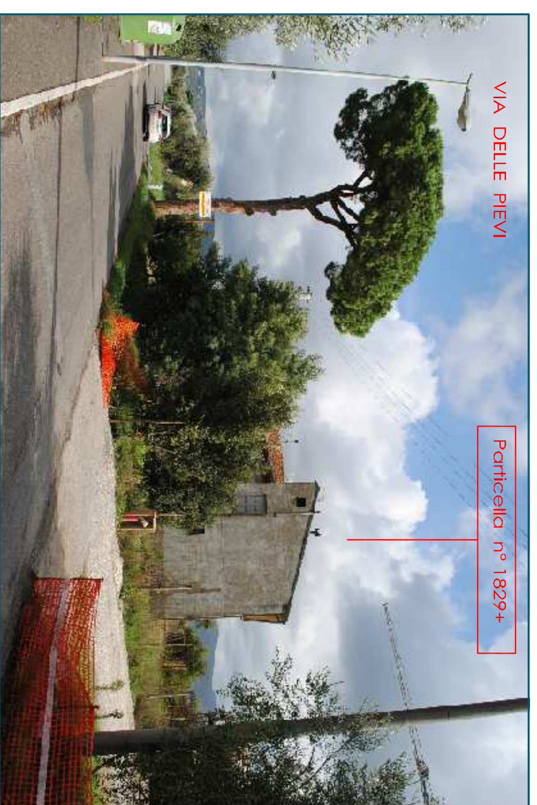
VIA DELLE PIEVI