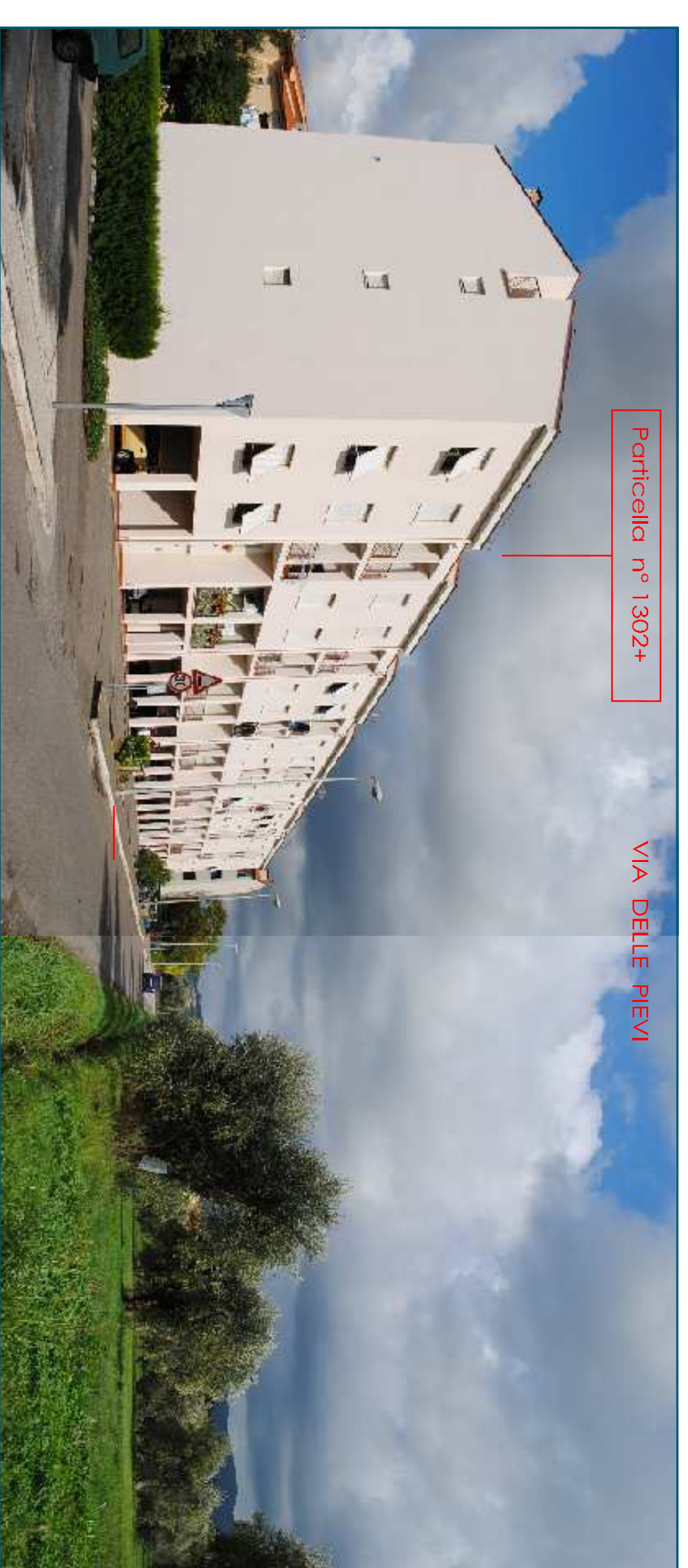
Particella n° 1302+