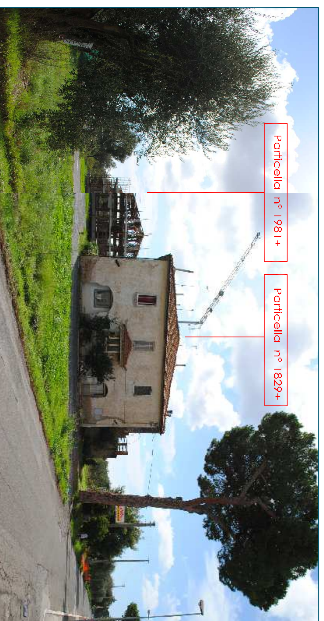
Particella n° 1981+