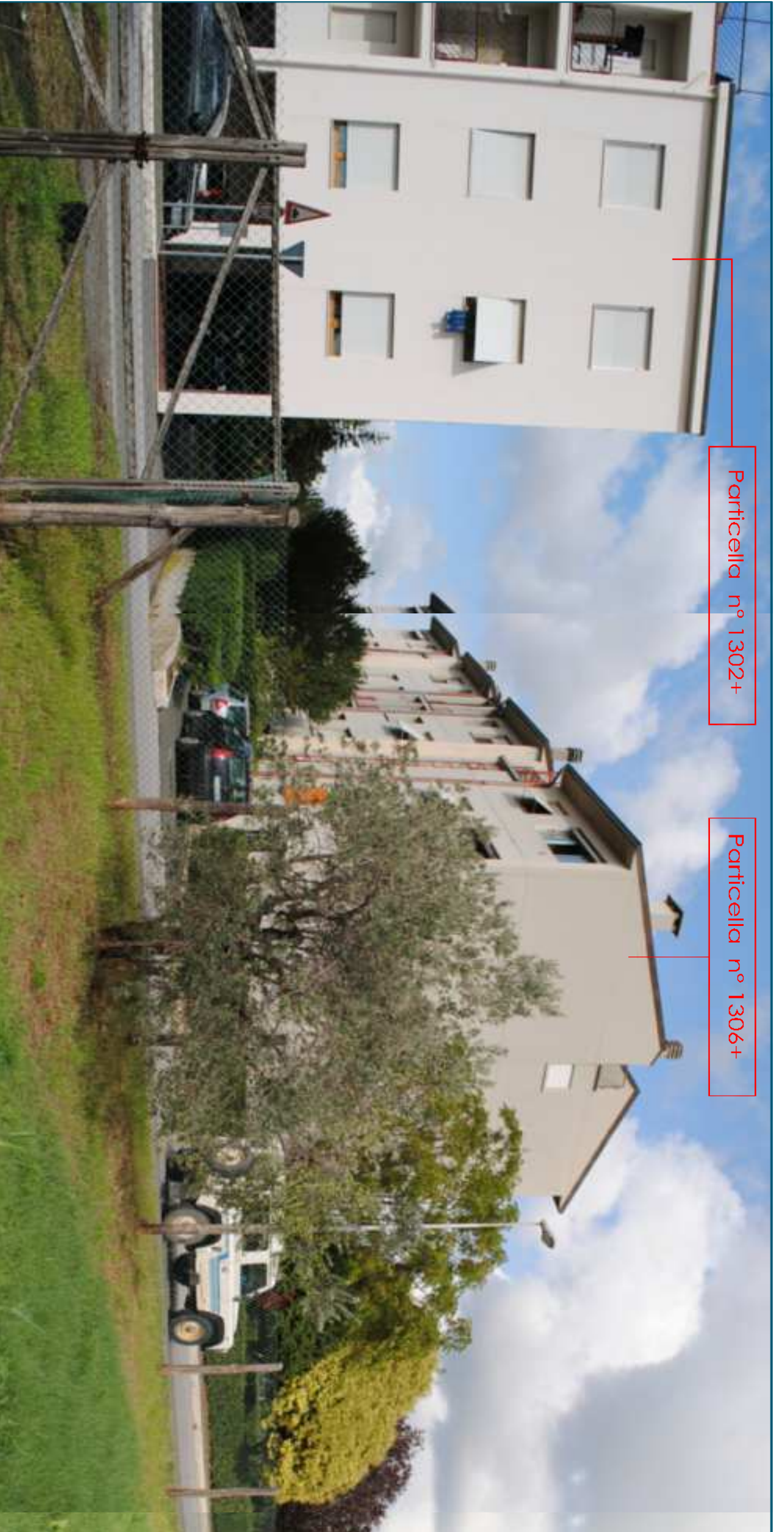
Particella n° 1302+