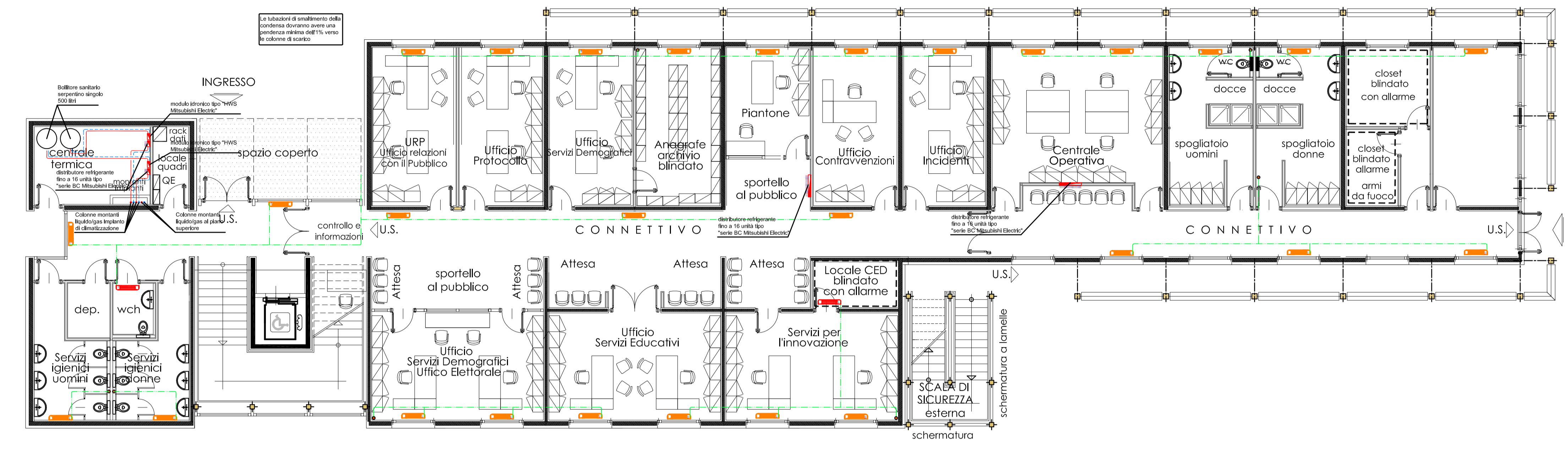
PIANTA PIANO TERRA scala 1:100