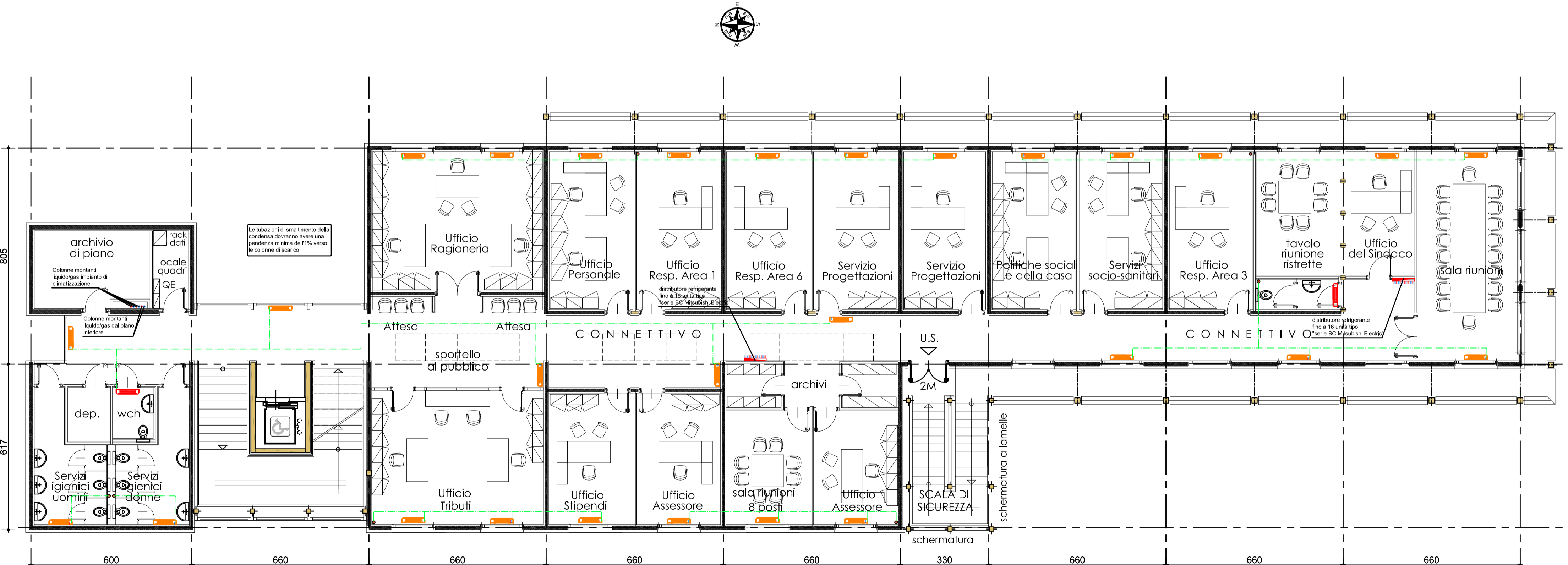
PIANTA PIANO PRIMO scala 1:100