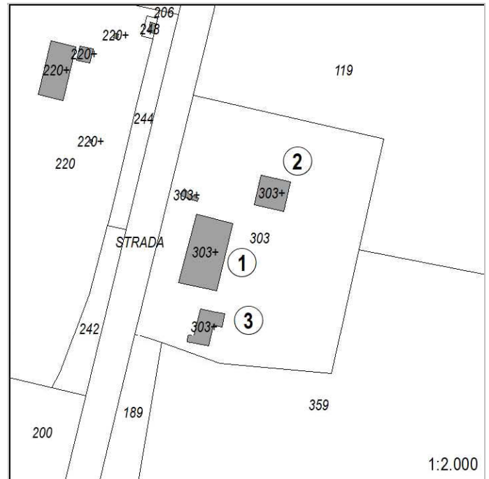
Estratto di Mappa Catastale