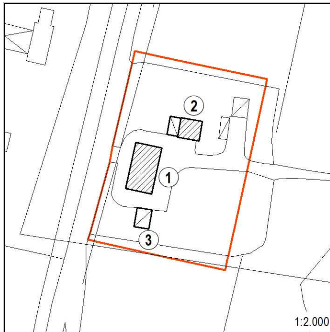
Estratto di Carta Tecnica Regionale con l'indicazione dell'Area di Pertinenza (perimetro rosso) di cui all'art 33.1 delle NTA