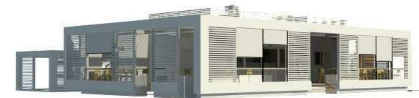
VISTA NORD-OVEST ( Ingresso Spiaggia)