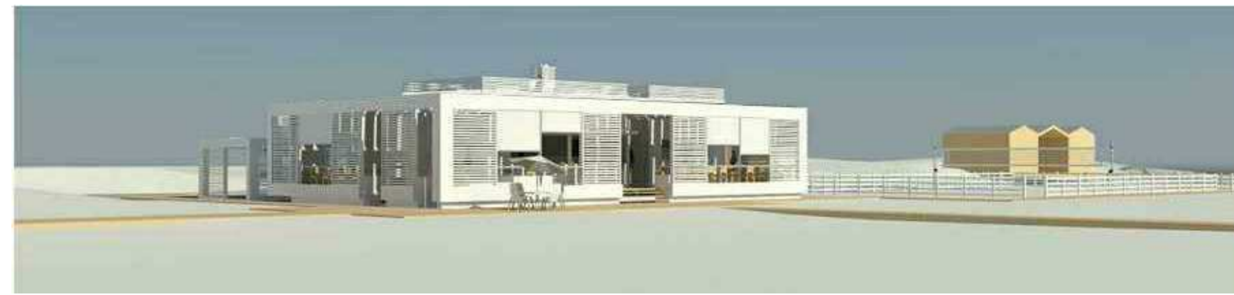
VISTA PROSPETTICA NORD- OVEST