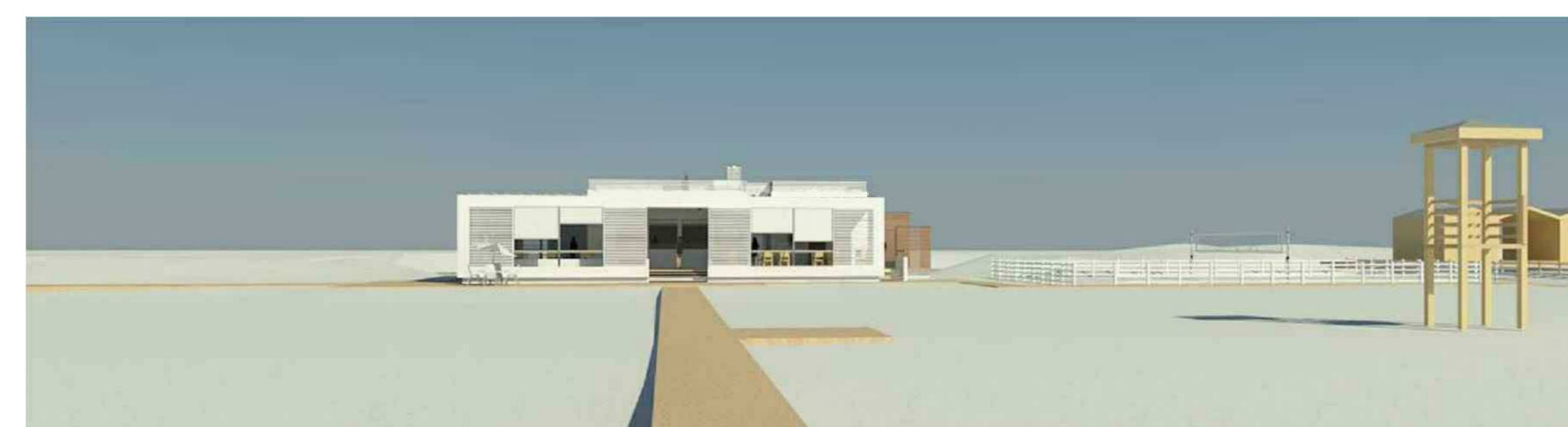
VISTA PROSPETTICA OVEST