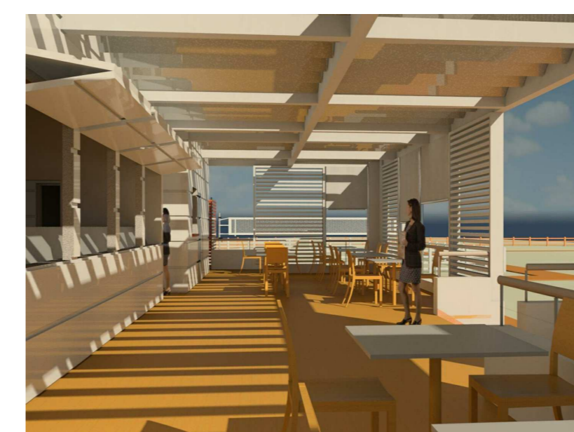
VISTA PROSPETTICA INTERNA