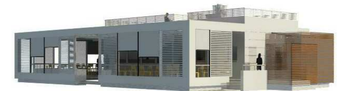
VISTA SUD-OVEST ( Lato Circolo Pescatori)