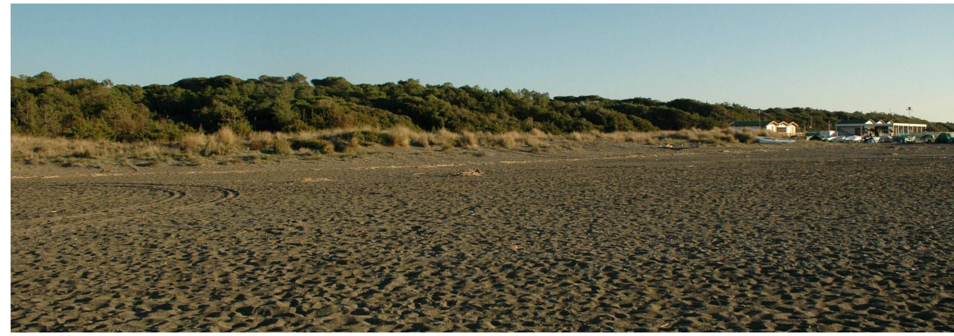
VISTA PROSPETTICA ATTUALE