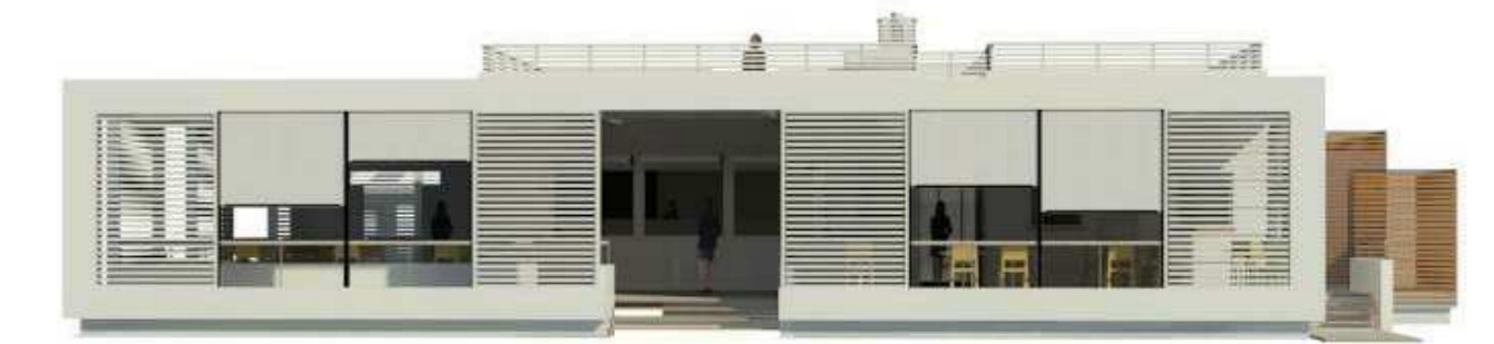
VISTA OVEST (Fronte Mare)