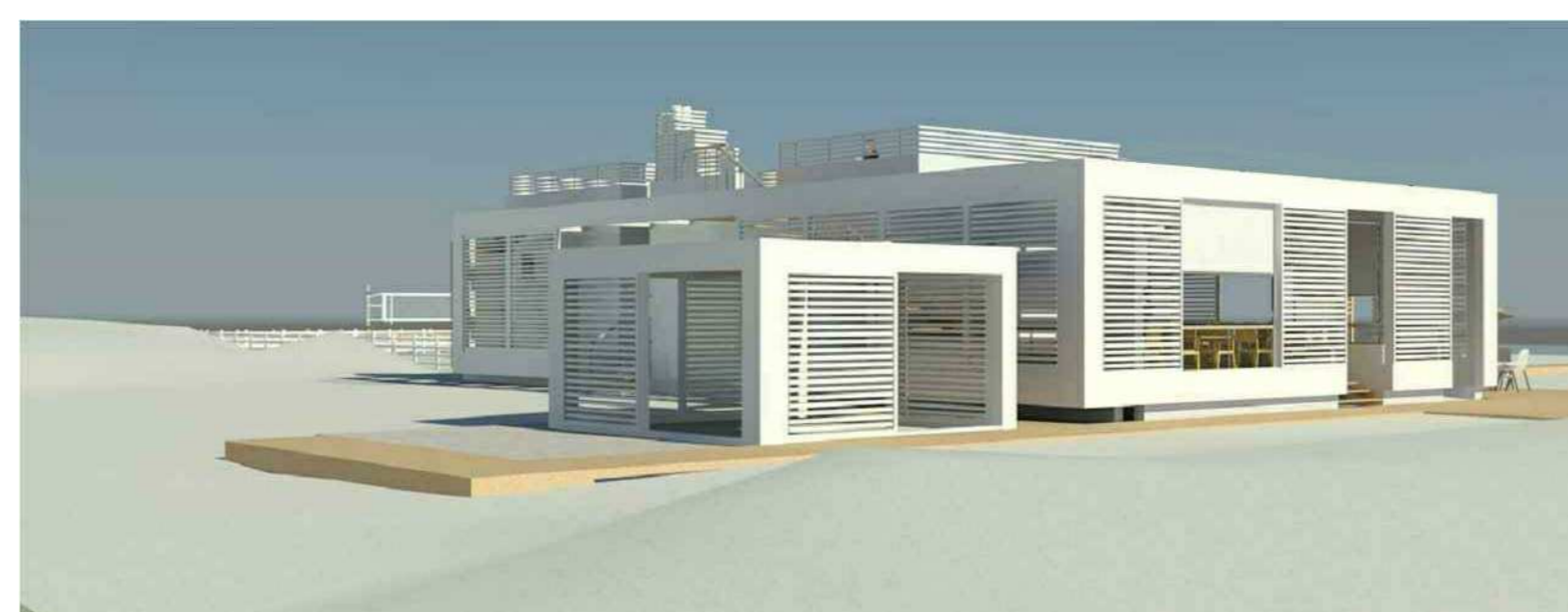
VISTA PROSPETTICA NORD-EST