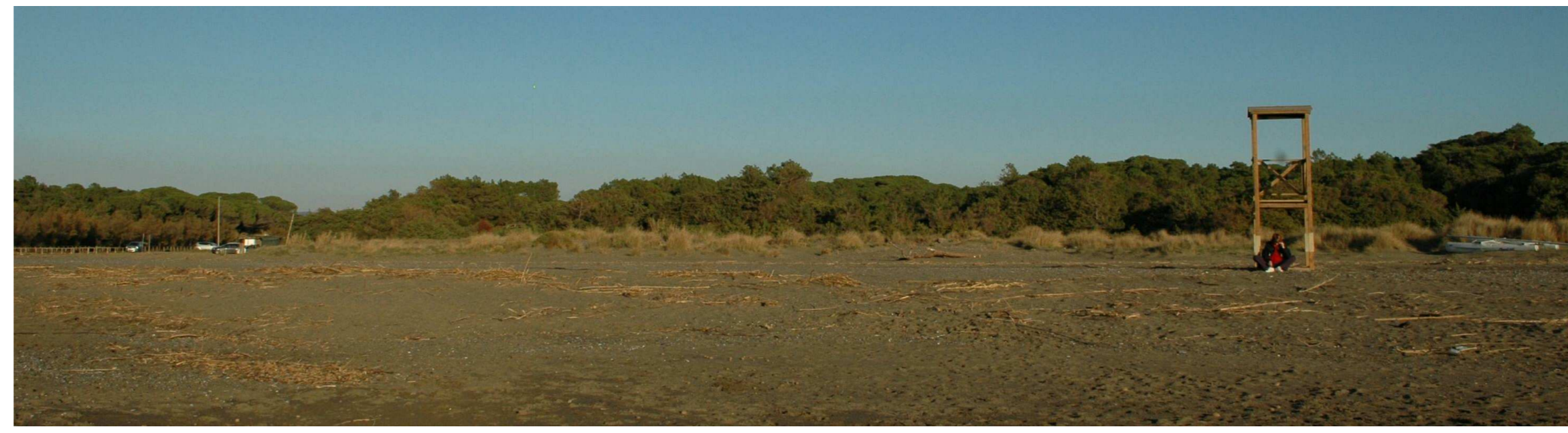
VISTA PROSPETTICA ATTUALE