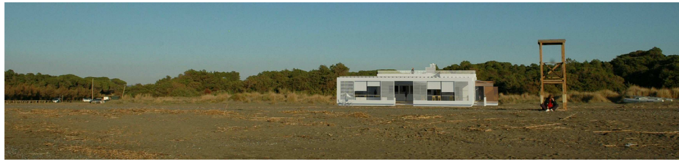
VISTA PROSPETTICA DI PROGETTO