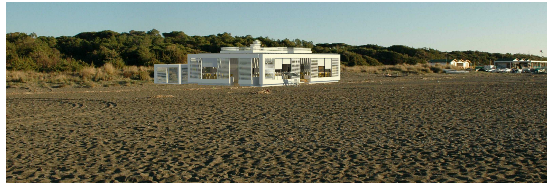
VISTA PROSPETTICA DI PROGETTO