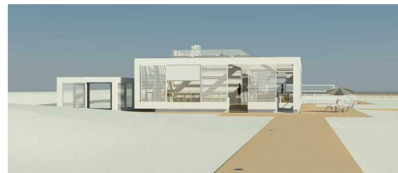
VISTA PROSPETTICA -NORD