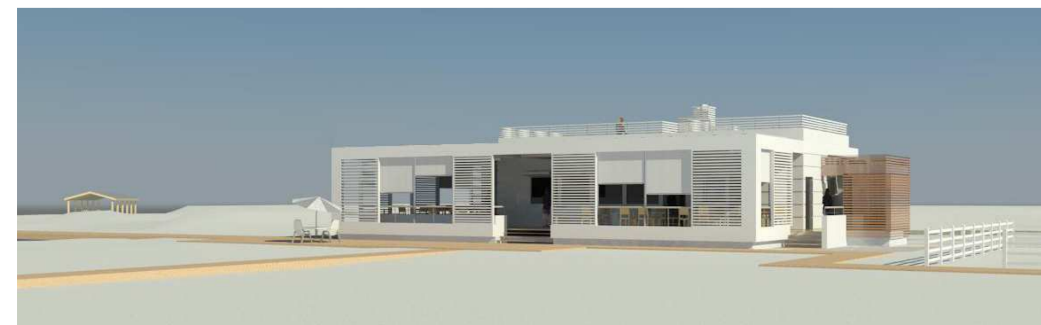
VISTA PROSPETTICA SUD -OVEST