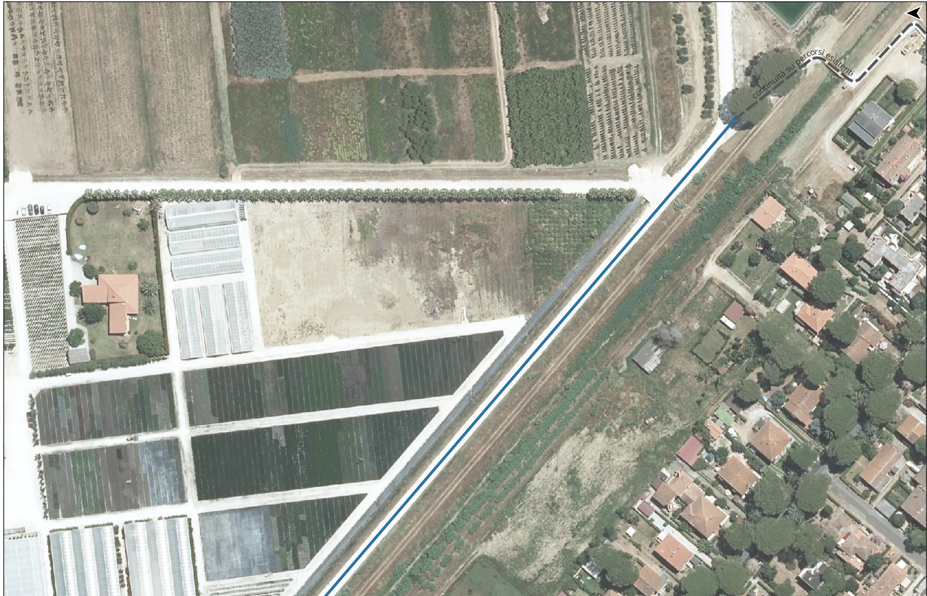
PROGETTO DI REALIZZAZIONE DELLA CICLOPISTA TIRRENICA PERCORSO VENTIMIGLIA-ROMA - TRATTO RICADENTE NEI COMUNI DI CASTAGNETO CARDUCCI E SAN VINCENZO