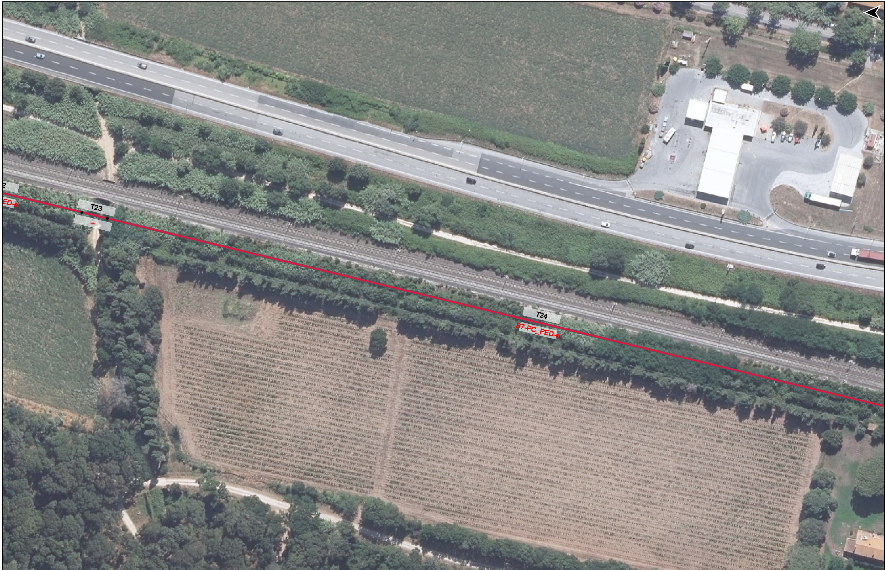
PROGETTO DI REALIZZAZIONE DELLA CICLOPISTA TIRRENICA PERCORSO VENTIMIGLIA-ROMA - TRATTO RICADENTE NEI COMUNI DI CASTAGNETO CARDUCCI E SAN VINCENZO