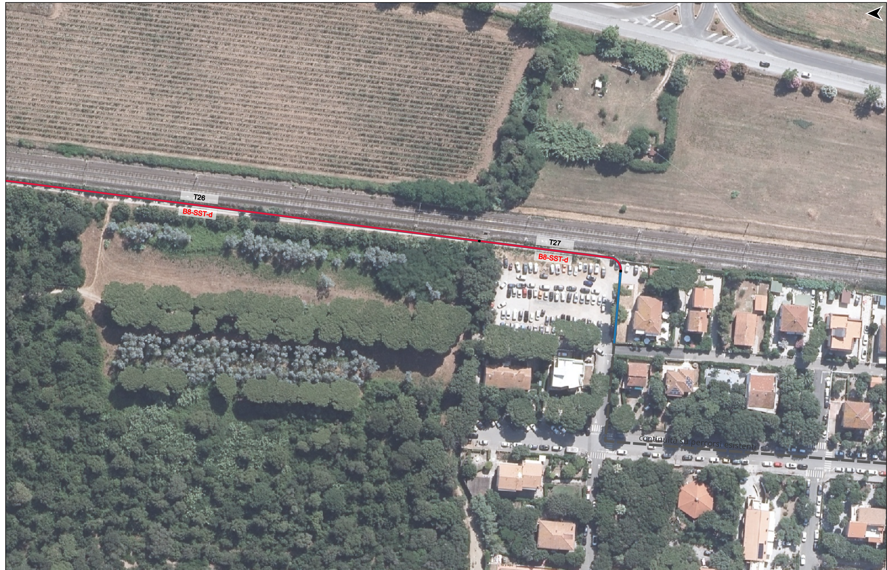
PROGETTO DI REALIZZAZIONE DELLA CICLOPISTA TIRRENICA PERCORSO VENTIMIGLIA-ROMA - TRATTO RICADENTE NEI COMUNI DI CASTAGNETO CARDUCCI E SAN VINCENZO