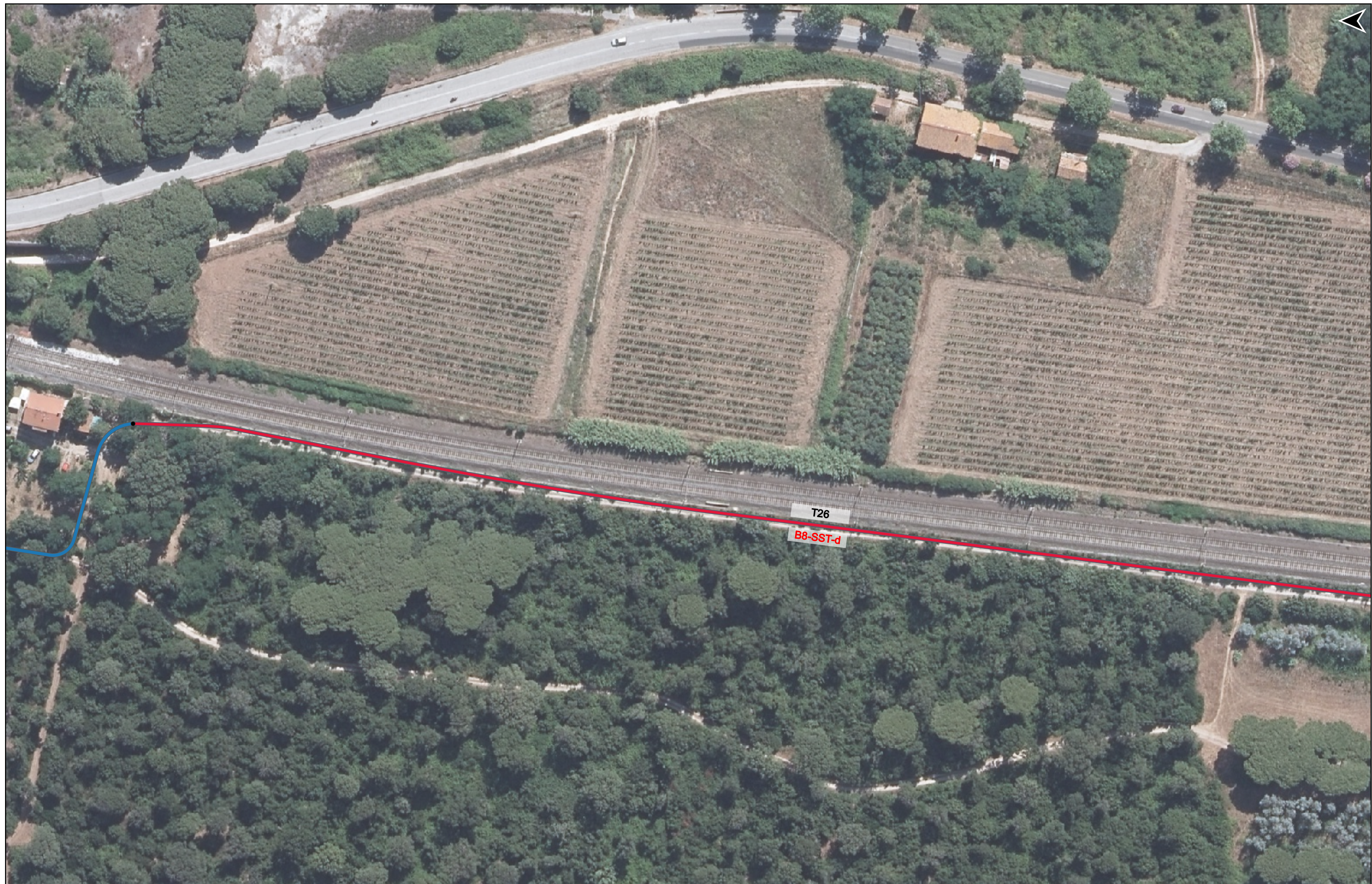
PROGETTO DI REALIZZAZIONE DELLA CICLOPISTA TIRRENICA PERCORSO VENTIMIGLIA-ROMA - TRATTO RICADENTE NEI COMUNI DI CASTAGNETO CARDUCCI E SAN VINCENZO