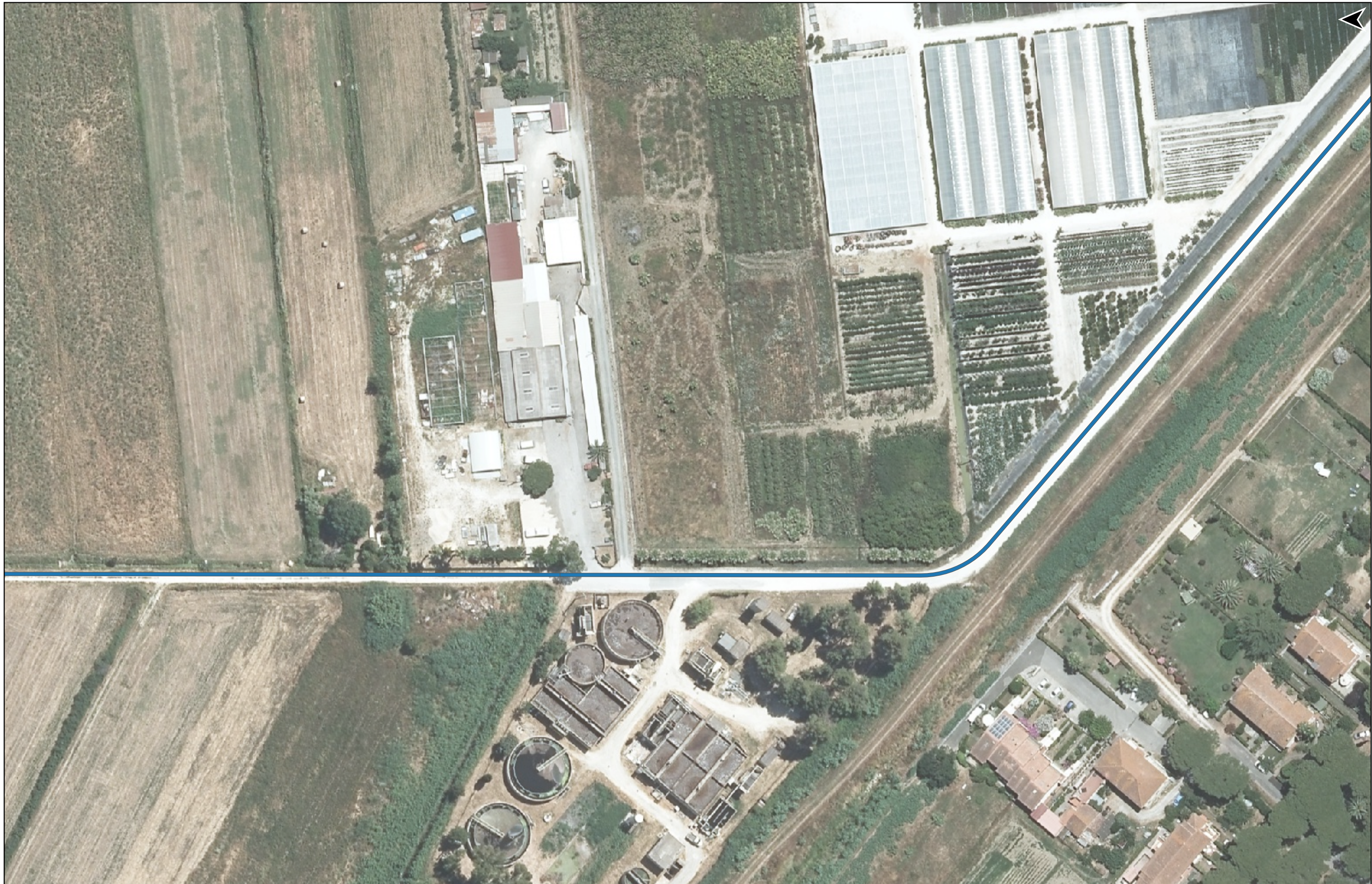
PROGETTO DI REALIZZAZIONE DELLA CICLOPISTA TIRRENICA PERCORSO VENTIMIGLIA-ROMA - TRATTO RICADENTE NEI COMUNI DI CASTAGNETO CARDUCCI E SAN VINCENZO