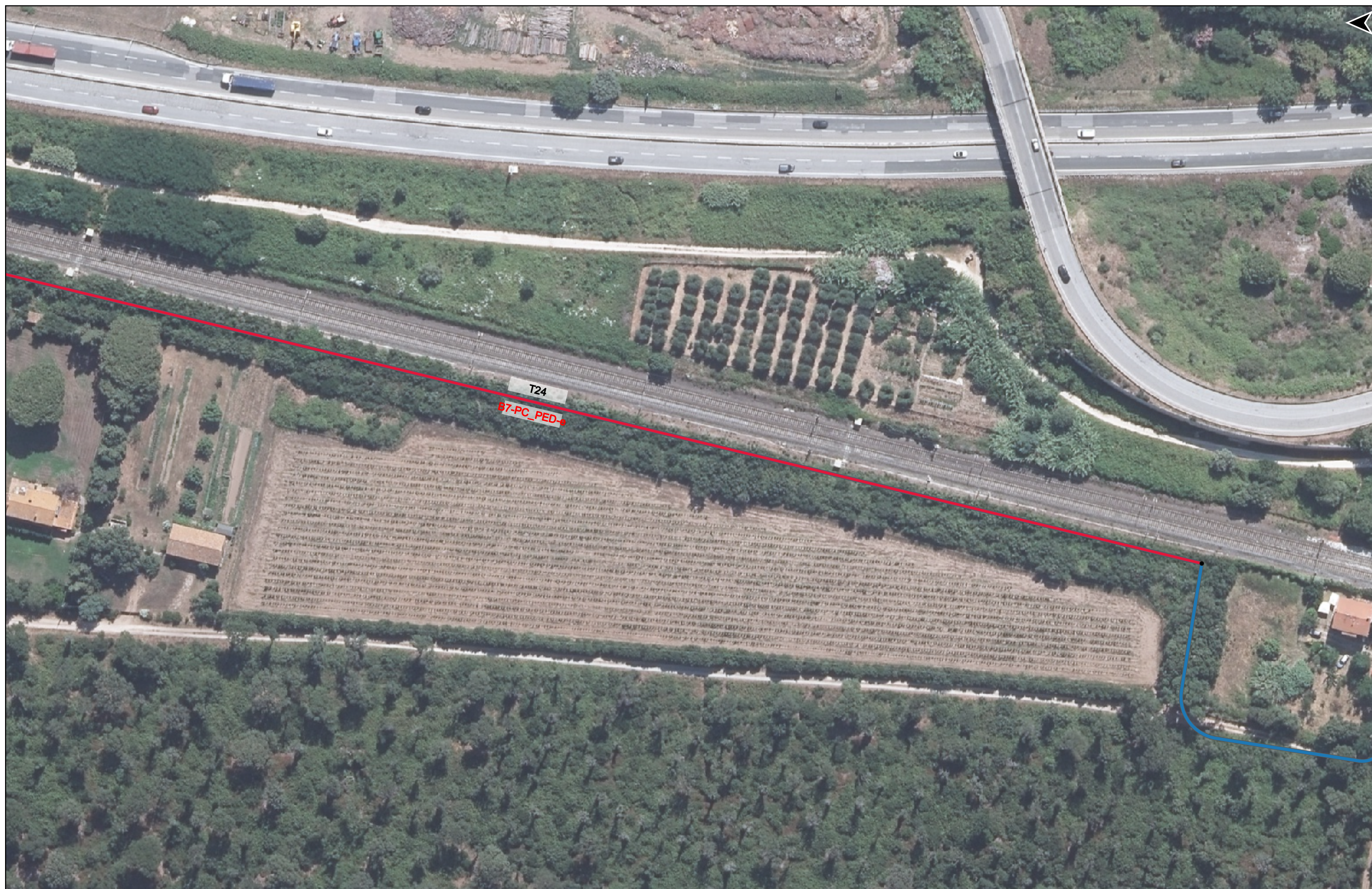
PROGETTO DI REALIZZAZIONE DELLA CICLOPISTA TIRRENICA PERCORSO VENTIMIGLIA-ROMA - TRATTO RICADENTE NEI COMUNI DI CASTAGNETO CARDUCCI E SAN VINCENZO