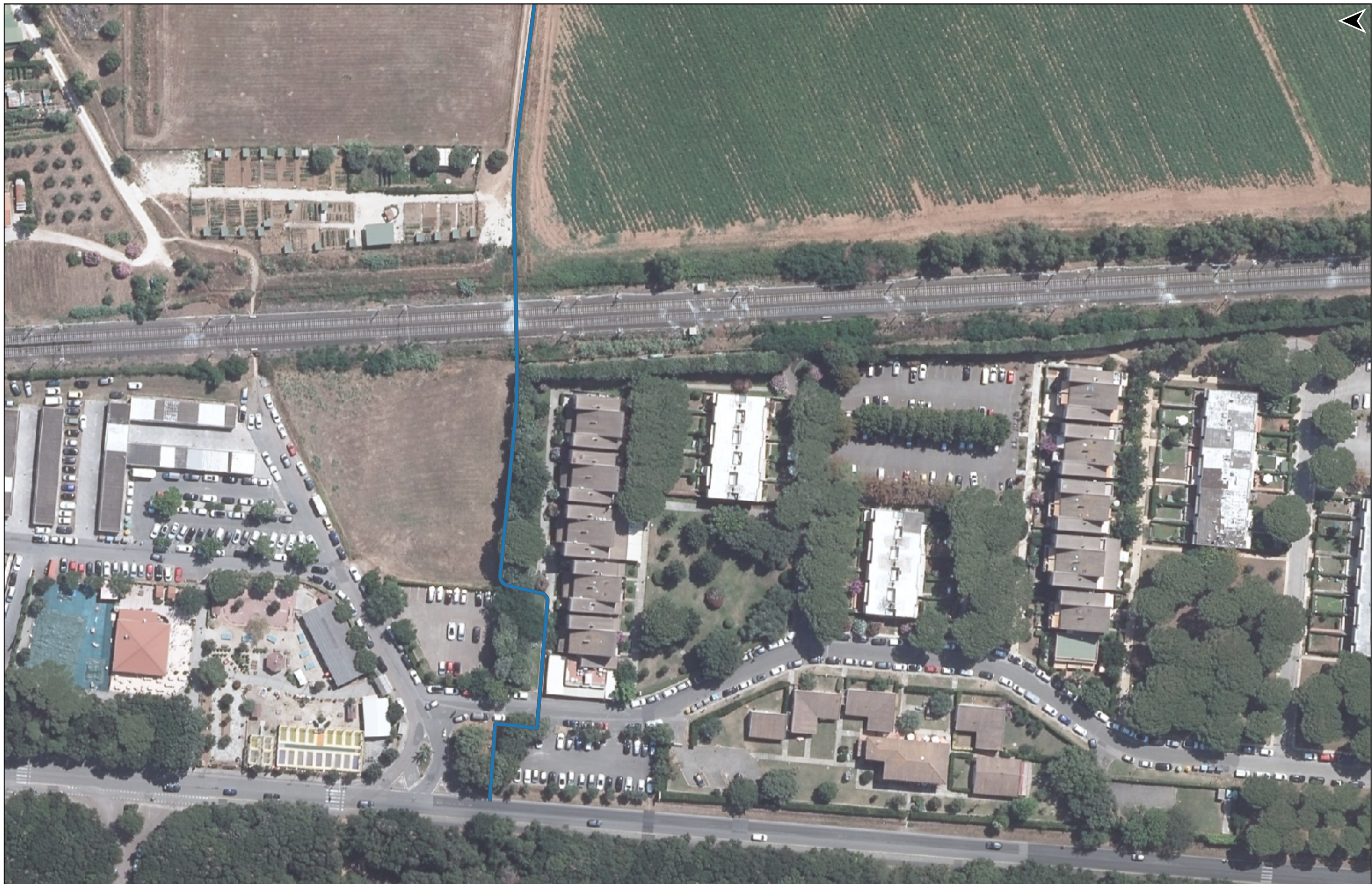
PROGETTO DI REALIZZAZIONE DELLA CICLOPISTA TIRRENICA PERCORSO VENTIMIGLIA-ROMA - TRATTO RICADENTE NEI COMUNI DI CASTAGNETO CARDUCCI E SAN VINCENZO