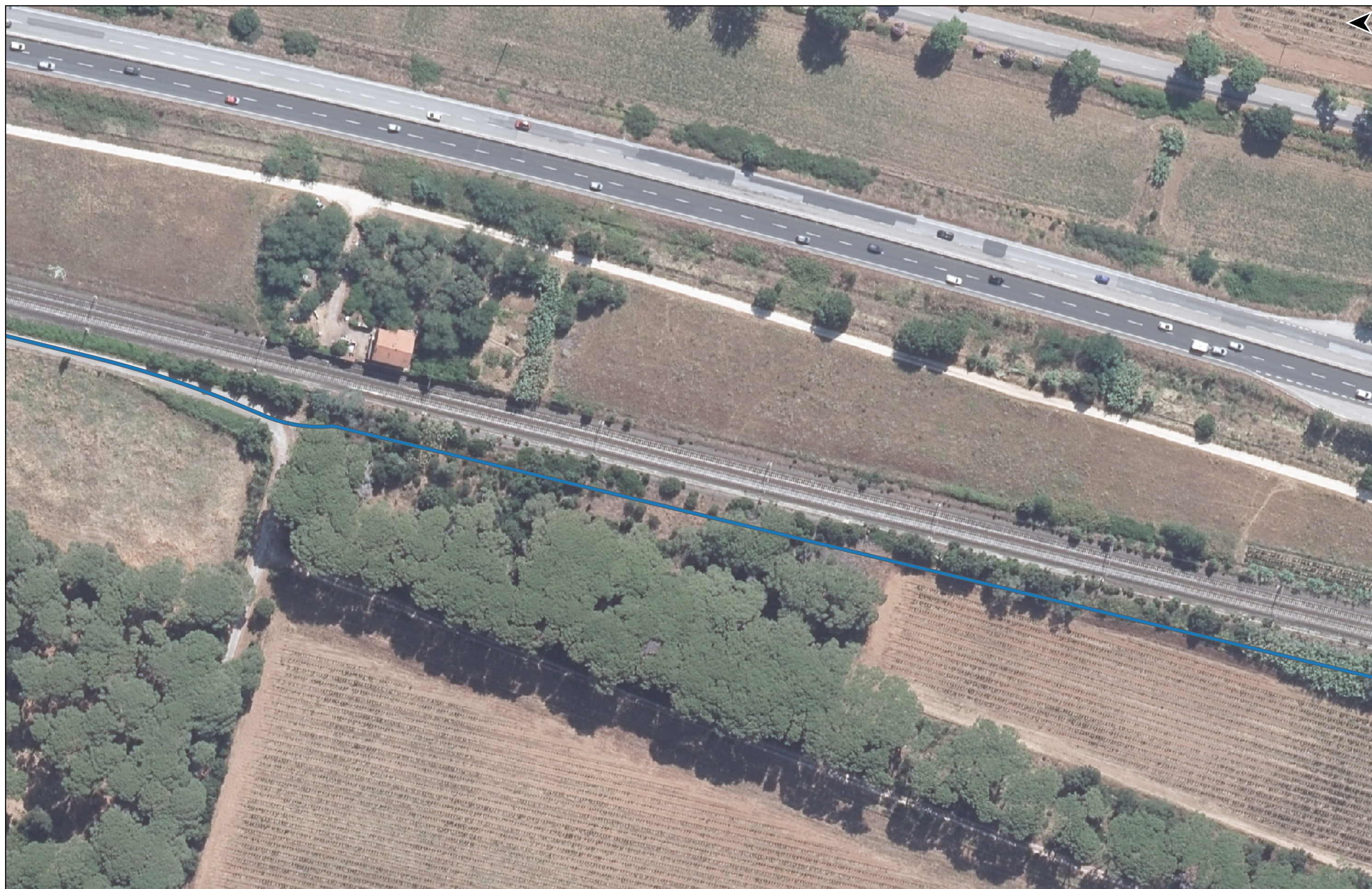
PROGETTO DI REALIZZAZIONE DELLA CICLOPISTA TIRRENICA PERCORSO VENTIMIGLIA-ROMA - TRATTO RICADENTE NEI COMUNI DI CASTAGNETO CARDUCCI E SAN VINCENZO