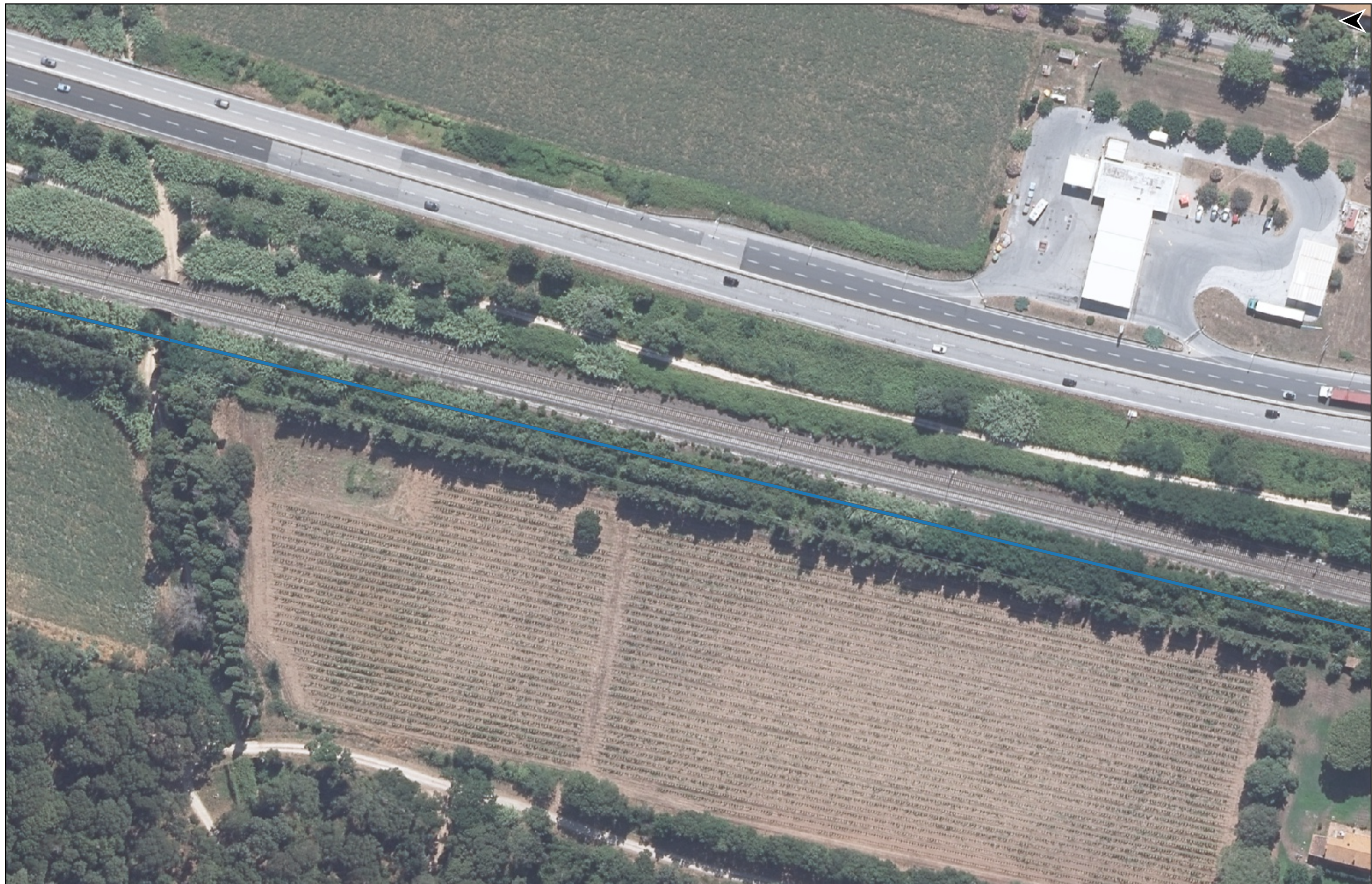
PROGETTO DI REALIZZAZIONE DELLA CICLOPISTA TIRRENICA PERCORSO VENTIMIGLIA-ROMA - TRATTO RICADENTE NEI COMUNI DI CASTAGNETO CARDUCCI E SAN VINCENZO