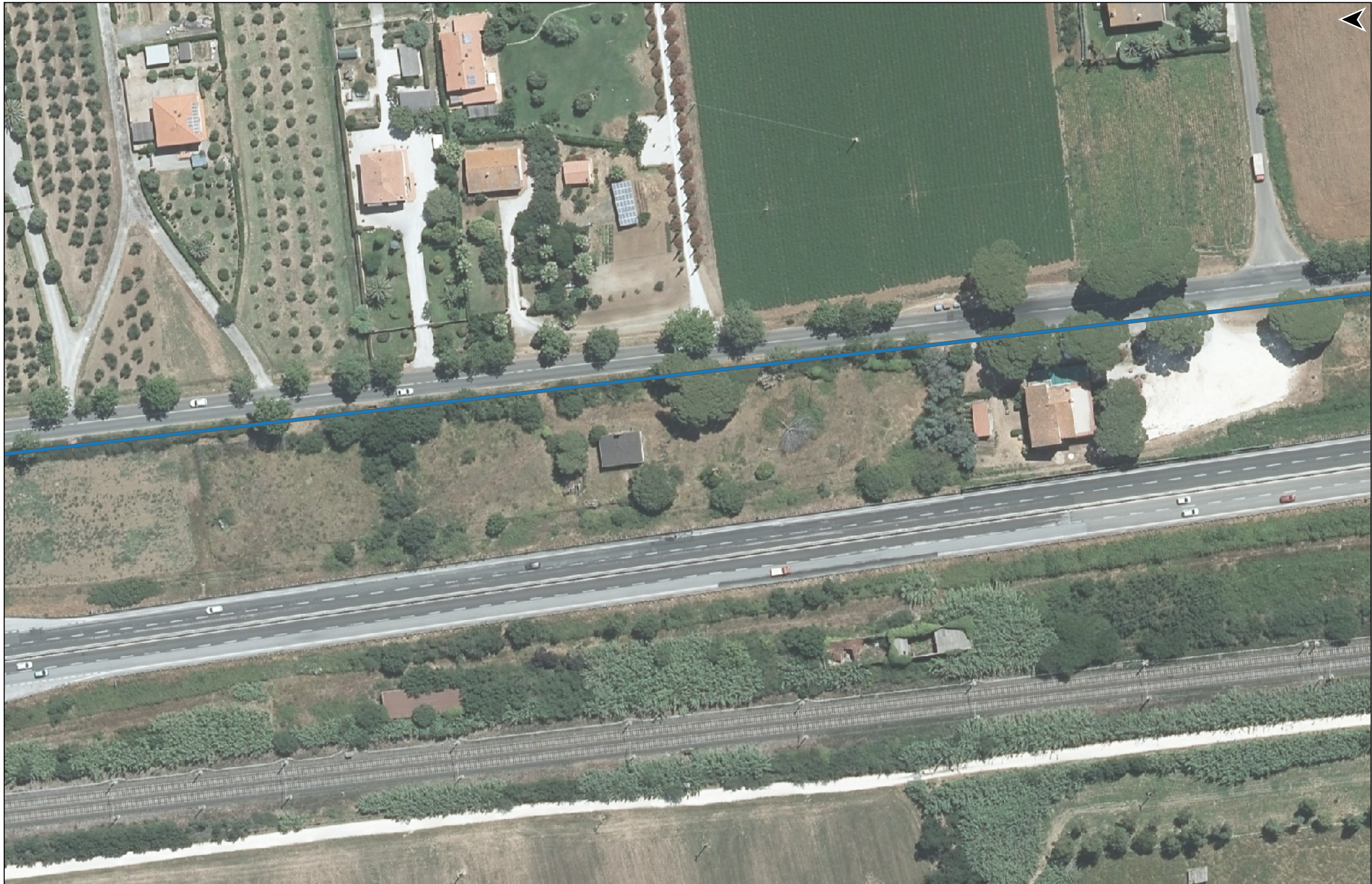
PROGETTO DI REALIZZAZIONE DELLA CICLOPISTA TIRRENICA PERCORSO VENTIMIGLIA-ROMA - TRATTO RICADENTE NEI COMUNI DI CASTAGNETO CARDUCCI E SAN VINCENZO