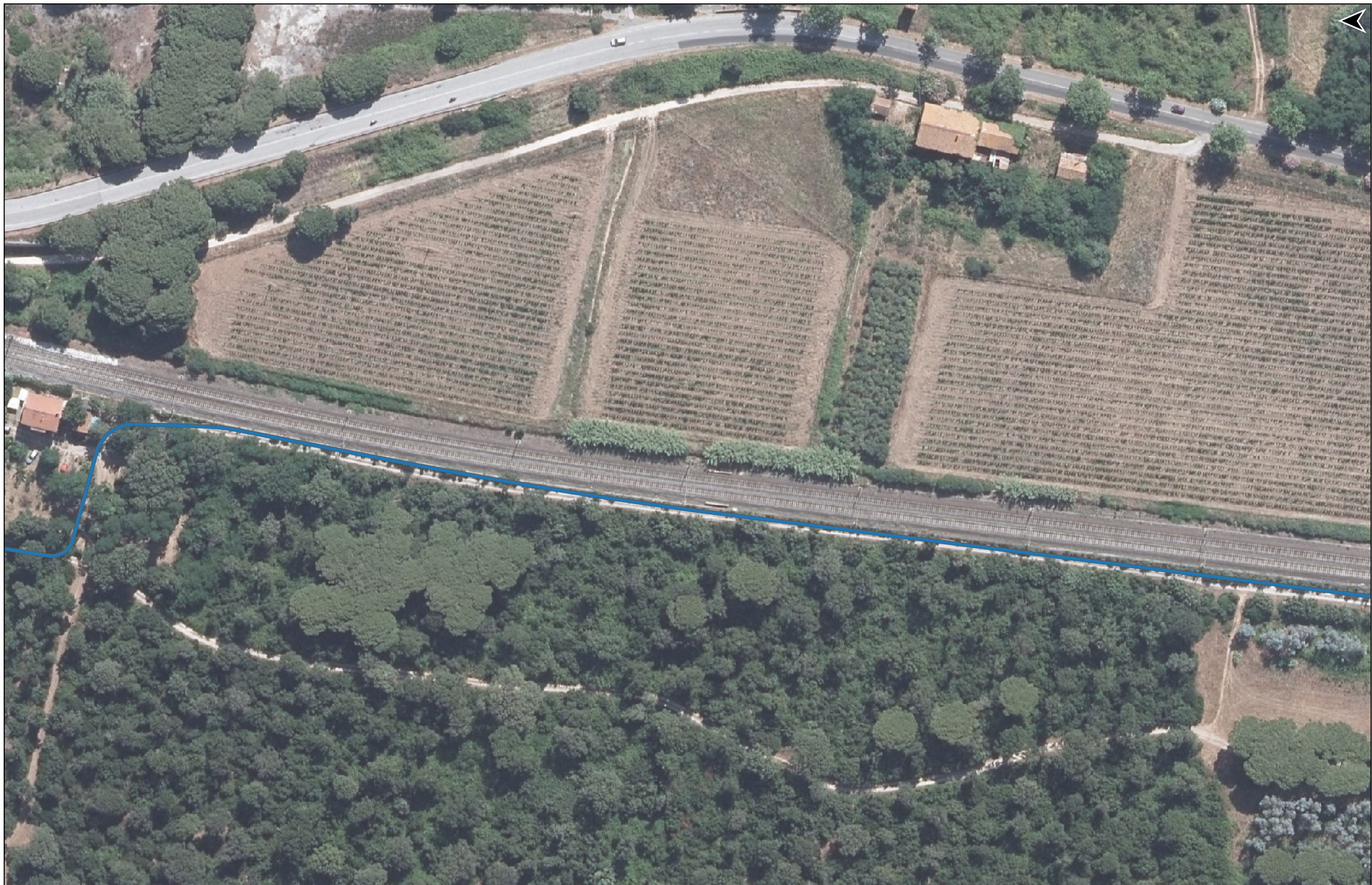
PROGETTO DI REALIZZAZIONE DELLA CICLOPISTA TIRRENICA PERCORSO VENTIMIGLIA-ROMA - TRATTO RICADENTE NEI COMUNI DI CASTAGNETO CARDUCCI E SAN VINCENZO