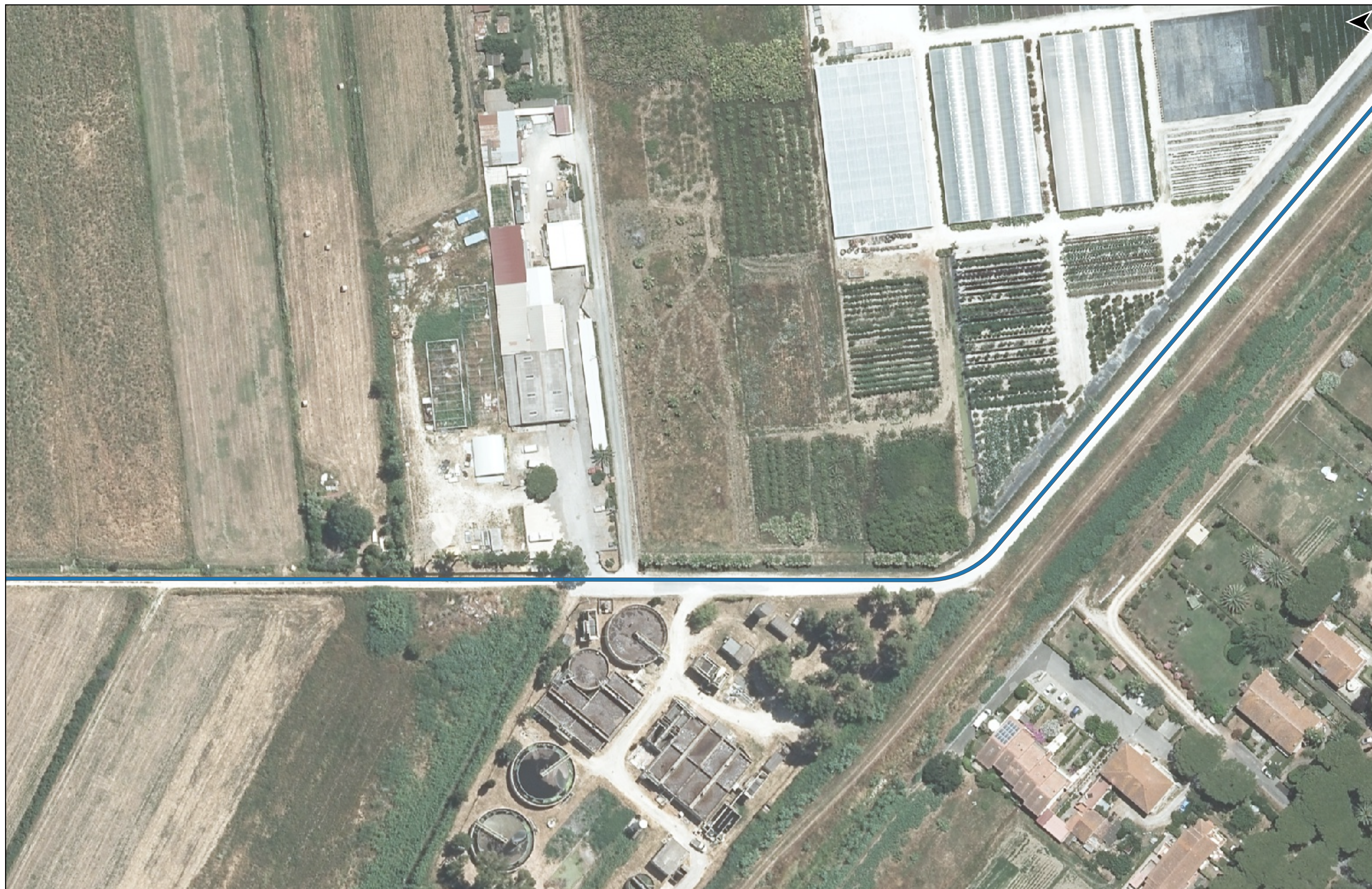
PROGETTO DI REALIZZAZIONE DELLA CICLOPISTA TIRRENICA PERCORSO VENTIMIGLIA-ROMA - TRATTO RICADENTE NEI COMUNI DI CASTAGNETO CARDUCCI E SAN VINCENZO