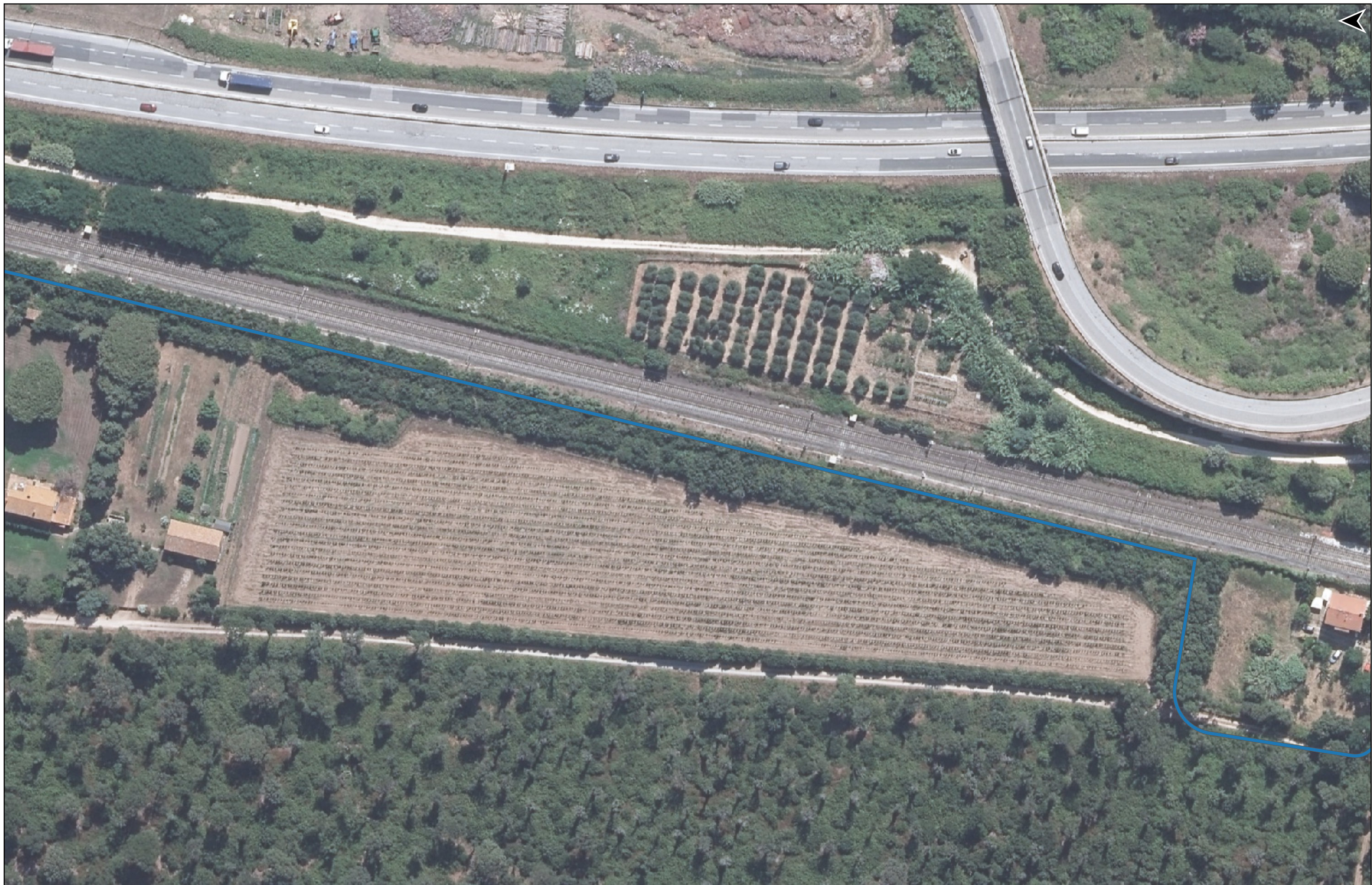
PROGETTO DI REALIZZAZIONE DELLA CICLOPISTA TIRRENICA PERCORSO VENTIMIGLIA-ROMA - TRATTO RICADENTE NEI COMUNI DI CASTAGNETO CARDUCCI E SAN VINCENZO