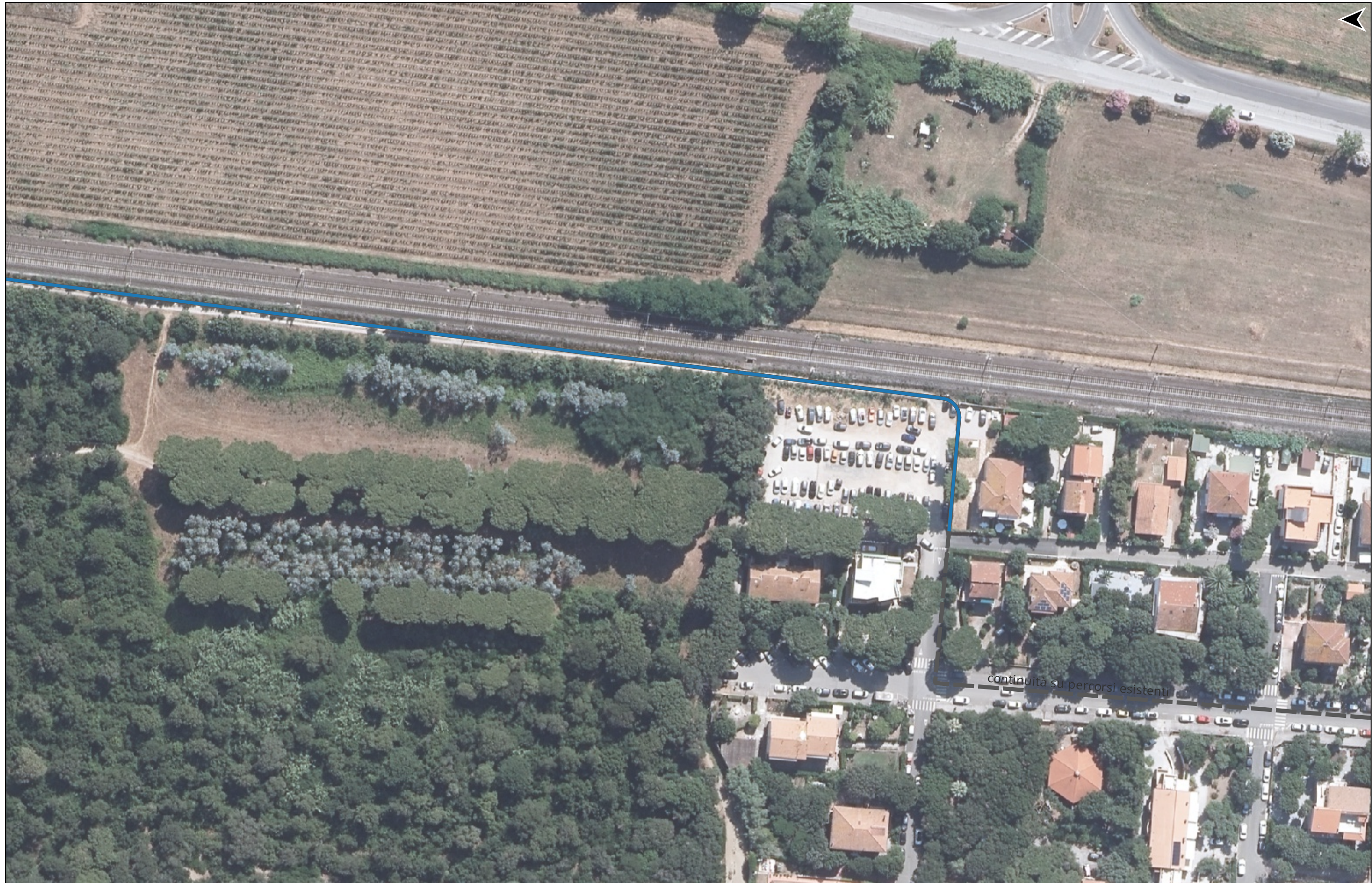
PROGETTO DI REALIZZAZIONE DELLA CICLOPISTA TIRRENICA PERCORSO VENTIMIGLIA-ROMA - TRATTO RICADENTE NEI COMUNI DI CASTAGNETO CARDUCCI E SAN VINCENZO