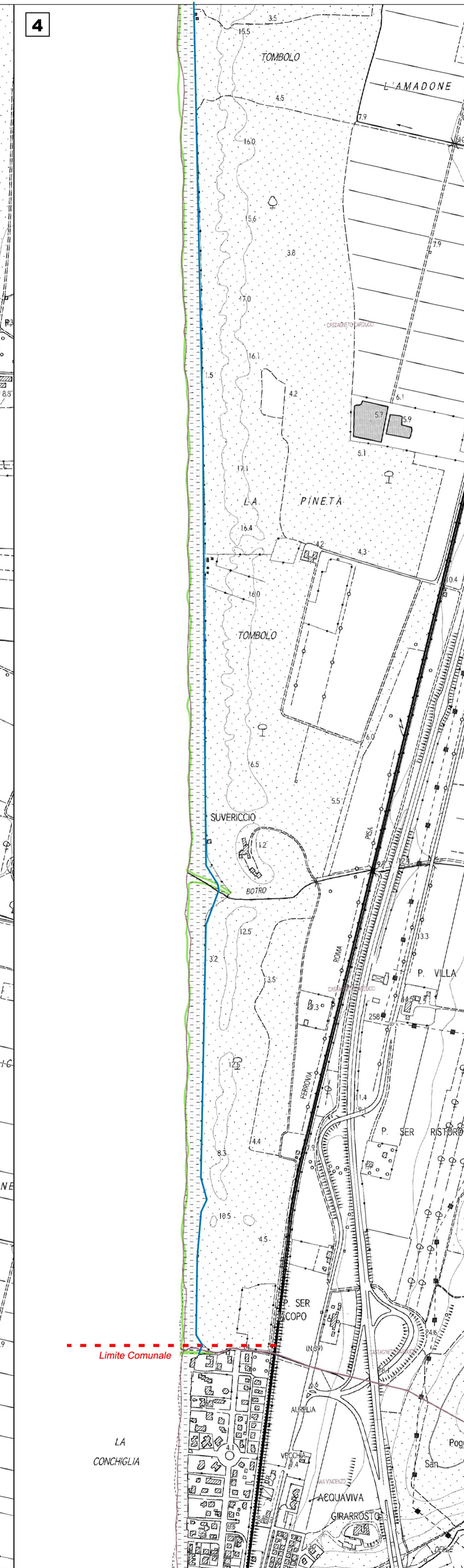
MAPPA 4 - ESTRATTO C.T.R. CON LAYER COMUNE CASTAGNETO CARDUCCI scala 1:5.000