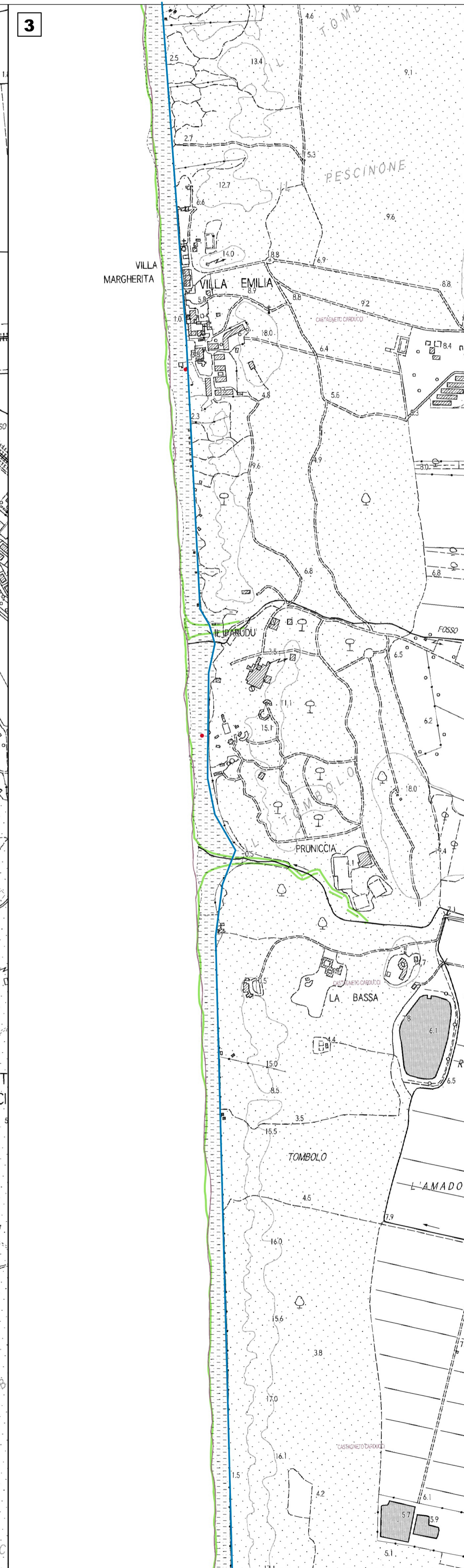
MAPPA 3 - ESTRATTO C.T.R. CON LAYER COMUNE CASTAGNETO CARDUCCI scala 1:5.000