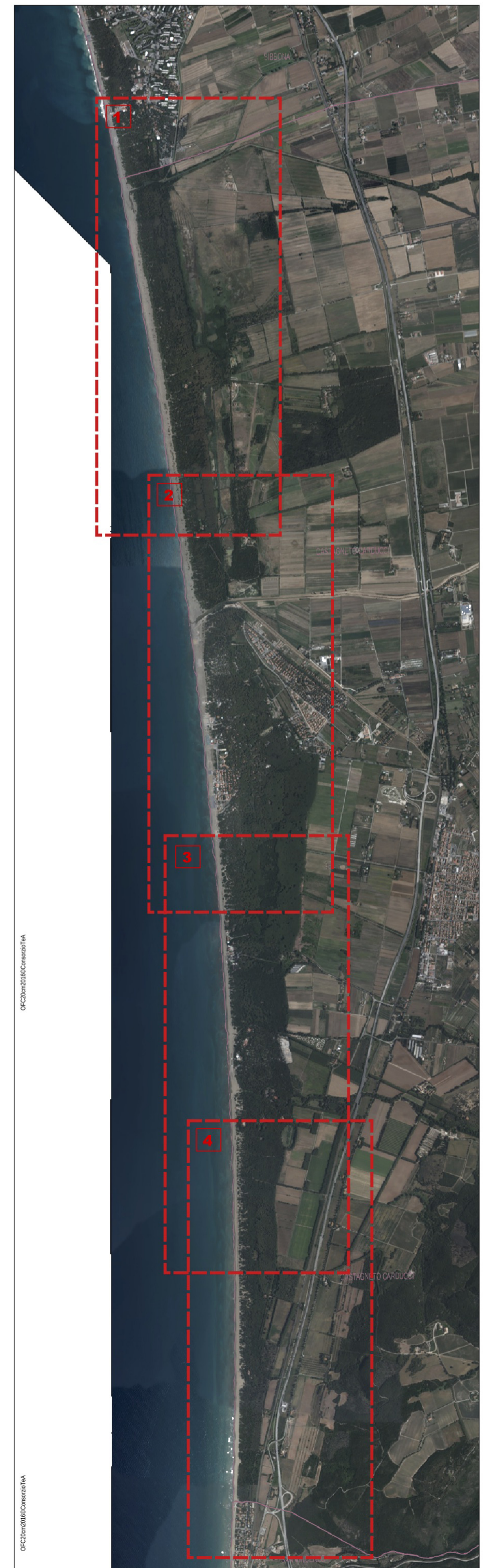
INQUADRAMENTO scala 1:30.000